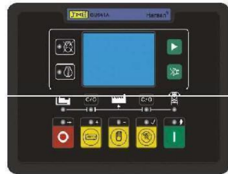
2) GU641B (AMF)